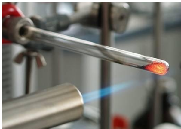
CO 2 kinyerése AMS mintából vákuumrendszerben történő égetéssel a debreceni AMS minta-előkészítő laboratóriumában

2014 április elején az érseki ujjcsont egy 1,7 grammos darabkáját használták fel a debreceni AMS C-14 méréshez. Ez közel 10%-os kollagén-tartalmat adott, amelyből megfelelő minőségű és tömegű AMS grafitmintát lehetett készíteni. A kalocsai érseki ujjcsont konvencionális radiokarbon kora a DeA-3865 nemzetközi labor kóddal jelzett AMS mérés szerint 1007 \pm 17 év volt, ami a lelet keletkezési idejét az i. sz. 1001-1030 közötti időszakra teszi.