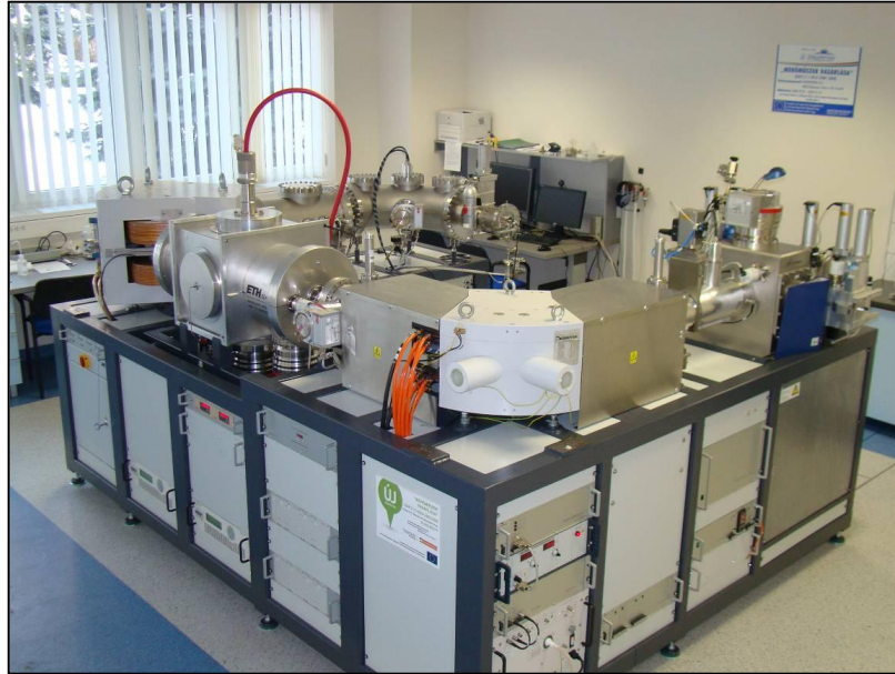
A debreceni EnvironMICADAS típusú AMS berendezés