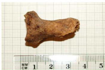
Az AMS radiokarbon mérésre felhasznált érseki ujjcsont

A Kalocsa-Kecskeméti Főegyházmegye honlapján jelentette be, hogy azonosították a Szent Koronát I. István királynak hozó Asztrik kalocsai érsek relikviáit. Eddig azt hitték, hogy az 1911-ben megtalált vörösmárvány szarkofág a XIII. század elején elhunyt Győr nembeli Saul érsek sírja volt. Idén áprilisban viszont a debreceni Hertelendi Ede Környezetanalitikai Laboratóriumban (MTA Atomki – Isotoptech Zrt) a csontmaradványból vett ujjcsonton végzett AMS radiokarbon mérések a lelet korát az i.sz. 1001–1030 közötti dátumok közé tették, ami így már egyértelműen Asztrik I. kalocsai érsekre utal, aki az írásos emlékek szerint ebben az időszakban hunyt el.